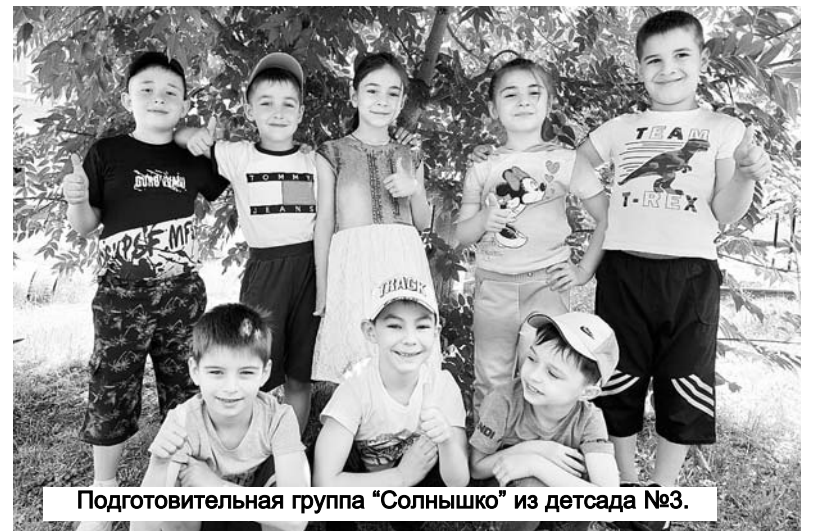
Подготовительная группа "Солнышко" из дetsада №3.

1 июня мы отмечаем Международный день защиты детей. Это не только один из самых радостных и любимых праздников для детворы, но и напоминание взрослым о том, что дети нуждаются в их постоянной заботе и защите, и что взрослые несут ответственность за них. Такое название связано с тем, что детство каждого ребенка должно быть под защитой — защитой прав, здоровья и жизни подрастающего поколения.